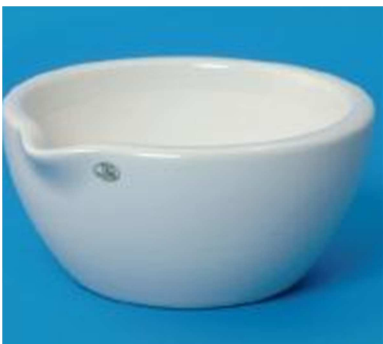
Miska třecí, porcelánová