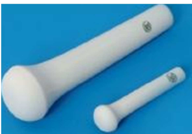
Tlouček třecí, porcelánový