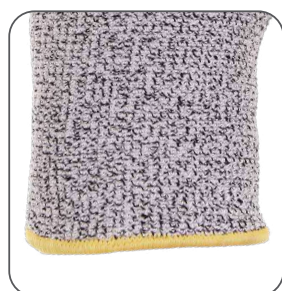
elastická manžeta elastic cuff elastyczny mankiet