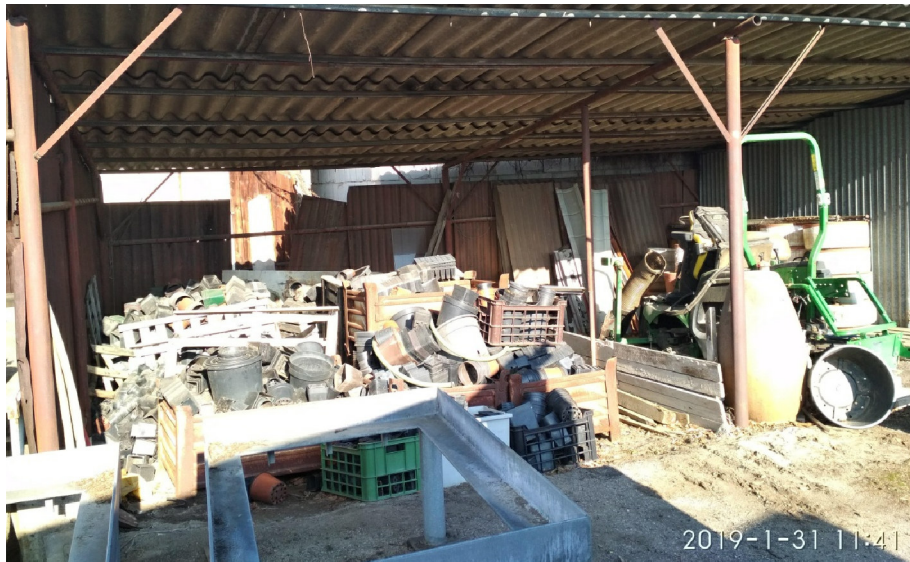
- DETAIL KCE ZÁPADNÍ ČÁSTI