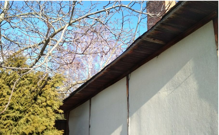
- DETAIL ZÁPADNÍHO ŠTÍTU