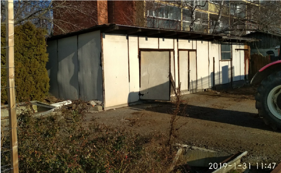
- CELKOVÝ POHLED NA JZ NÁROŽÍ