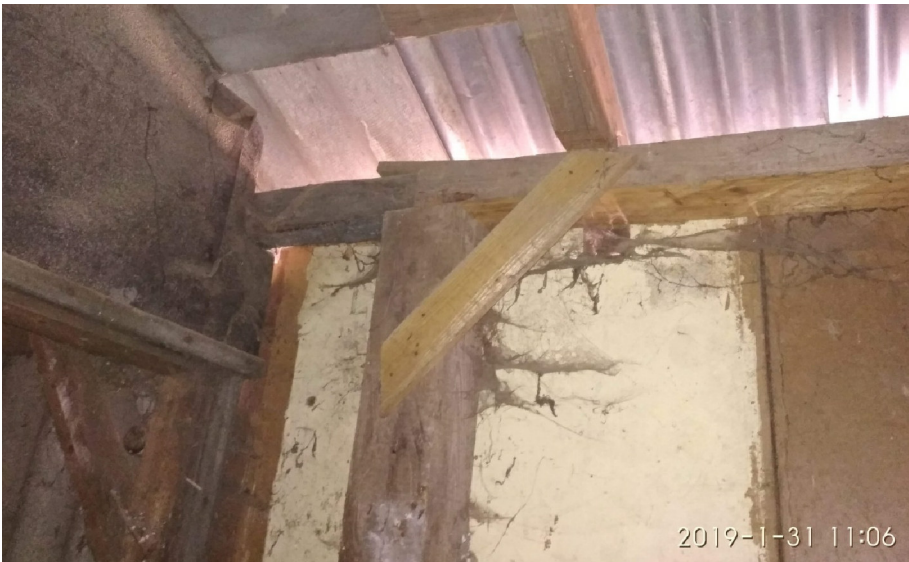
- DETAIL PŘECHODU PLECHOVÉ STŘEŠNÍ KRYTINY NA OSINKOCEMENT