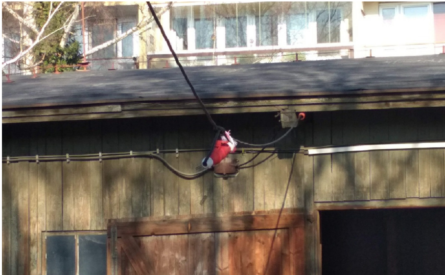
- DETAIL PROVIZORNÍ PŘÍPOJKY ELEKTRO