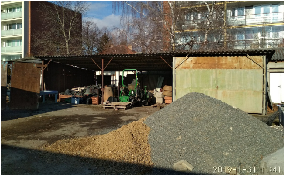
- CELKOVÝ POHLED Z JIHU