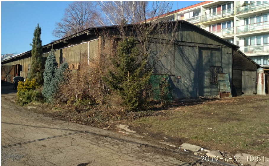
- POHLED NA JV NÁROŽÍ