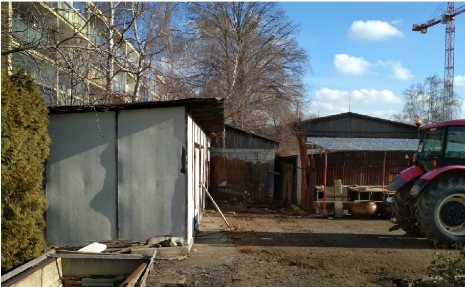
- POHLED ZE ZÁPADU