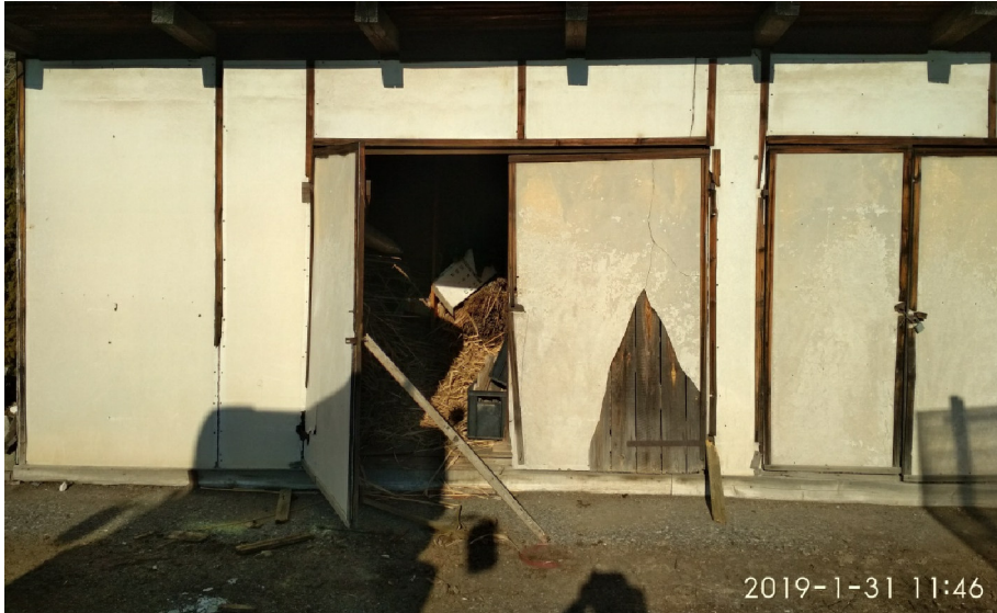
- POHLED NA ZÁPADNÍ ČÁST JIŽNÍHO PRŮČELÍ