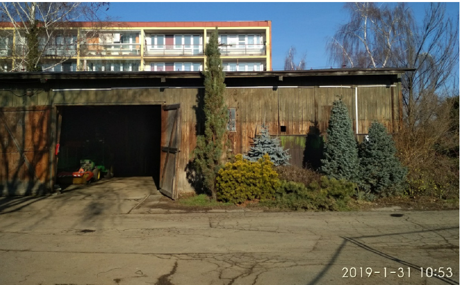
- POHLED NA VÝCHODNÍ ČÁST PRŮČELÍ