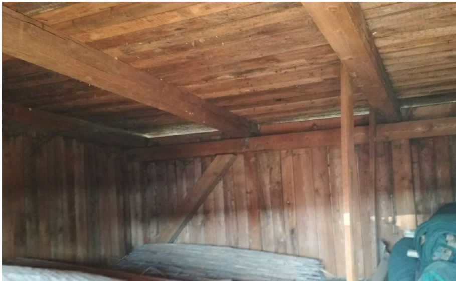
- VNITŘNÍ DETAIL DŘEVĚNÉHO OPLÁŠTĚNÍ