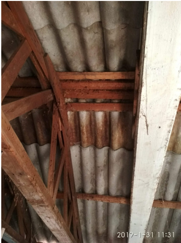
- DETAIL DŘEVĚNÉHO STŘEŠNÍHO VAZNÍKU