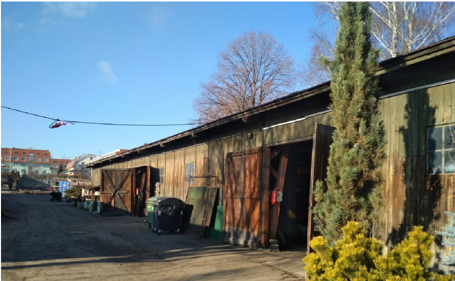
- POHLED NA JIŽNÍ PRŮČELÍ