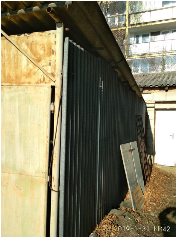
- POHLED NA JV NÁROŽÍ