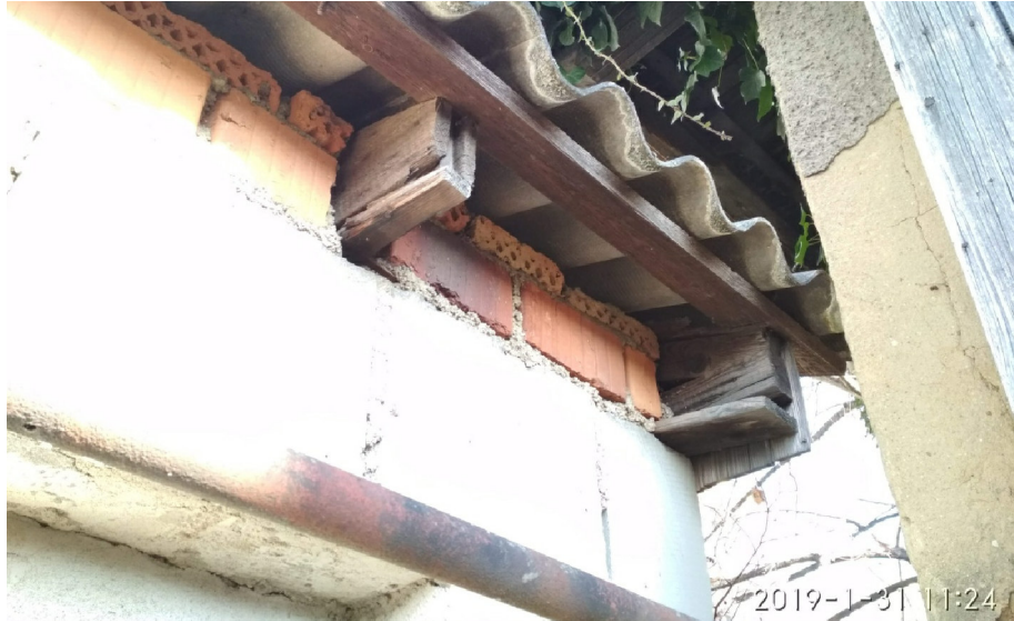
- DETAIL ULOŽENÍ STŘEŠNÍ KCE