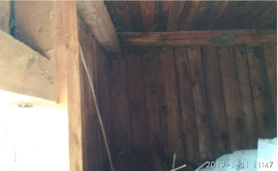
- VNITŘNÍ DETAIL KCE DŘEVĚNÉHO OPLÁŠTĚNÍ