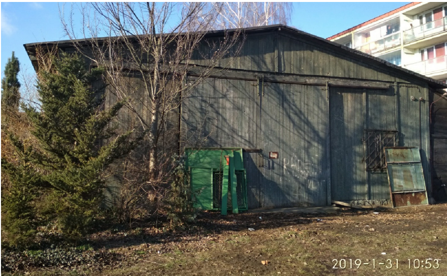
- POHLED Z VÝCHODU