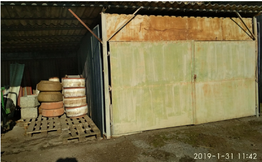
- VÝCHODNÍ KRYTÁ ČÁST OBJEKTU