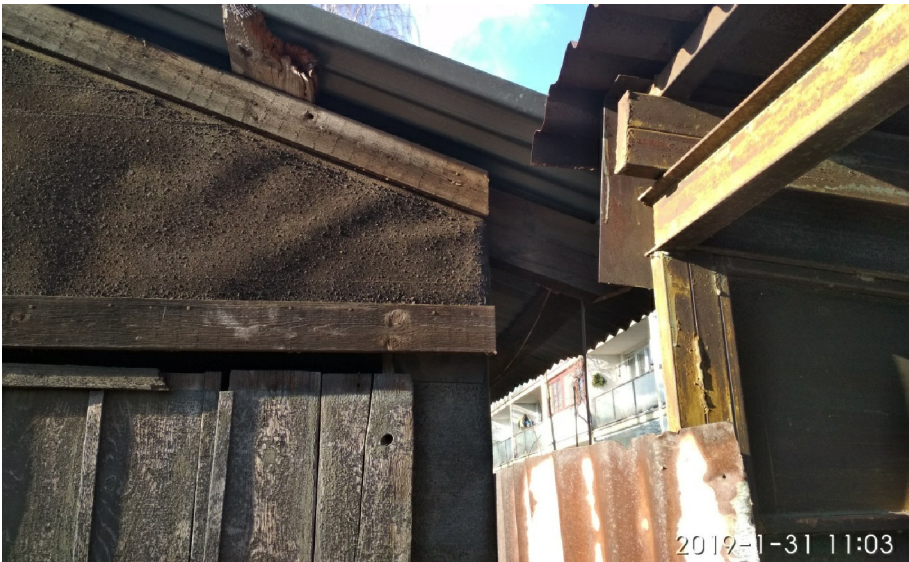
- DETAIL NÁVAZNOSTI KCÍ