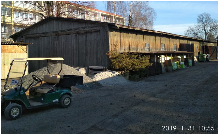
- POHLED NA JZ NÁROŽÍ