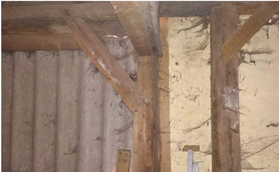
- DETAIL PŘECHODU DESKOVÉHO OBVODOVÉHO PLÁŠTĚ NA OSINKOCEMENT