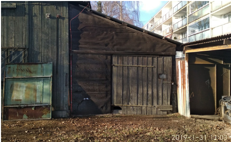
- POHLED Z VÝCHODU