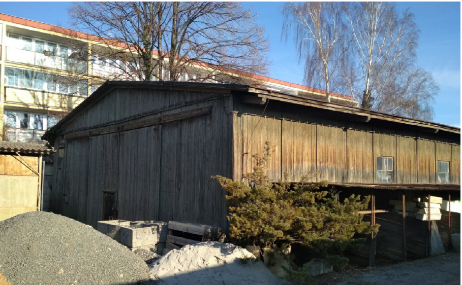
- POHLED NA JZ NÁROŽÍ