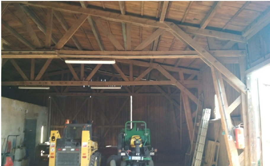
- POHLED NA NOSNOU DŘEVĚNOU VAZBU HALY