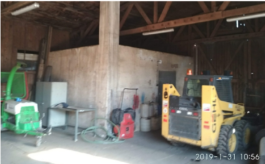
- VNITŘNÍ VESTAVBA VE VÝCHODNÍ ČÁSTI HALY