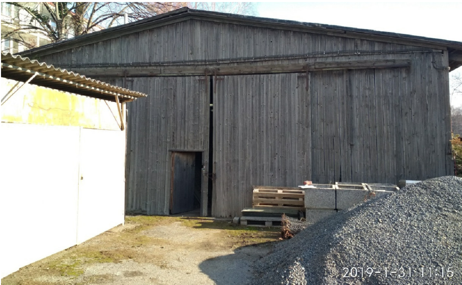
- POHLED ZE ZÁPADU