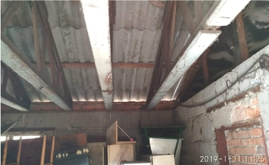
- VNITŘNÍ POHLED NA STŘEŠNÍ OSINKOCEMENTOVÝ PLÁŠŤ