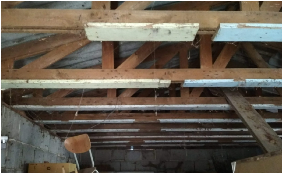
- VNITŘNÍ POHLED NA STŘEŠNÍ VAZNÍKY