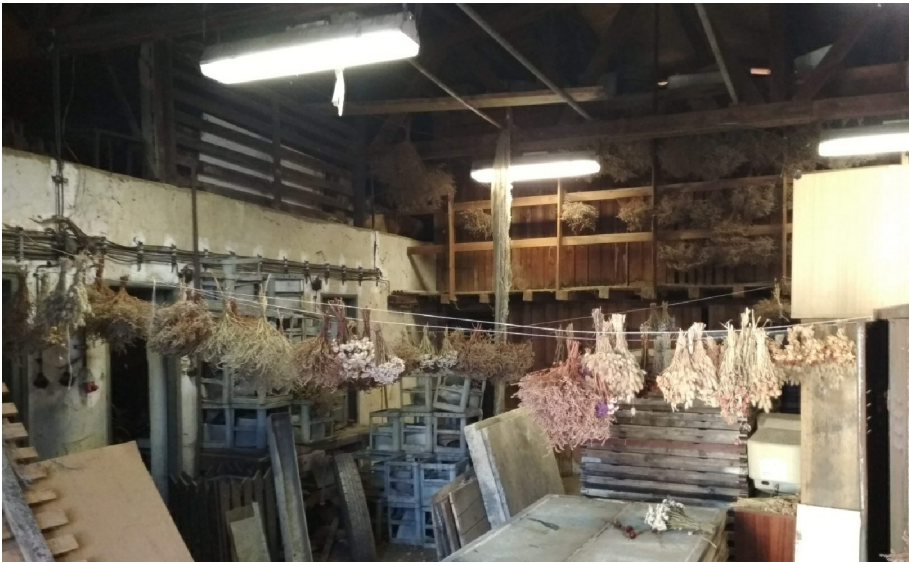
- VNITŘNÍ VESTAVBA V ZÁPADNÍ ČÁSTI HALY