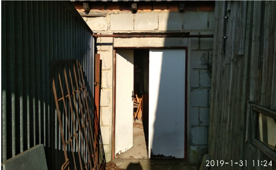
- POHLED NA VSTUP