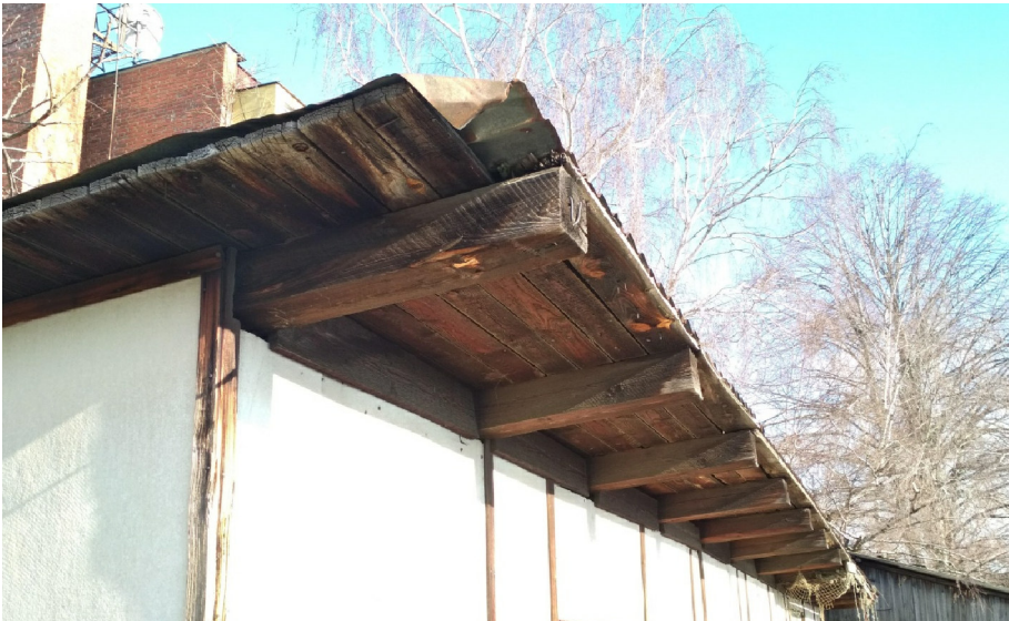
- DETAIL KCE PŘESAHU STŘECHY