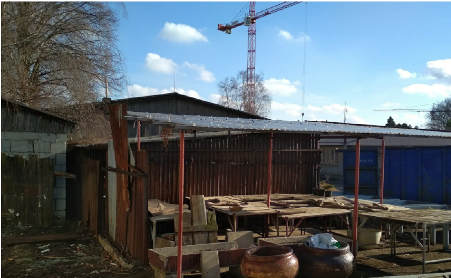
- POHLED NA SZ NÁROŽÍ - ZASTŘEŠENÍ POLYKARBONÁTEM