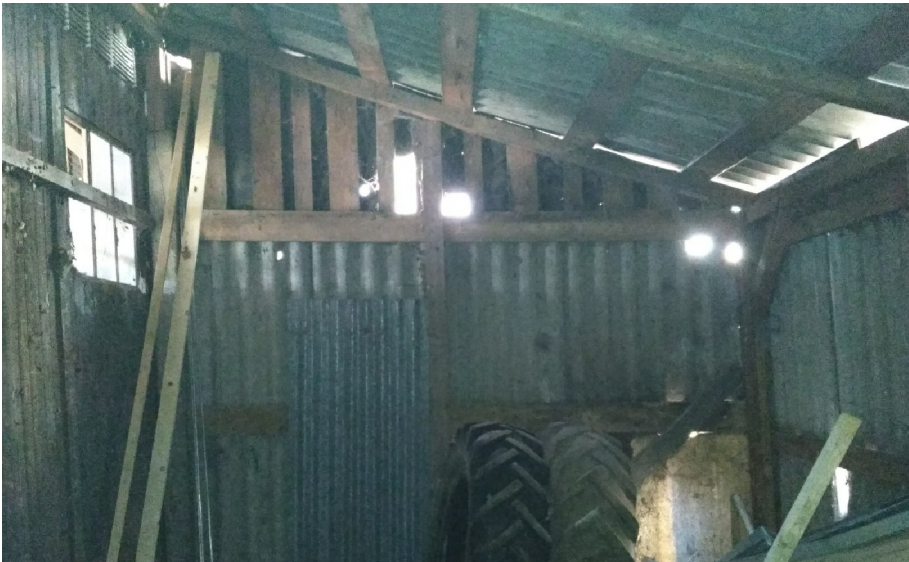
- DETAIL OSINKOCEMENTOVÉHO OPLÁŠTĚNÍ