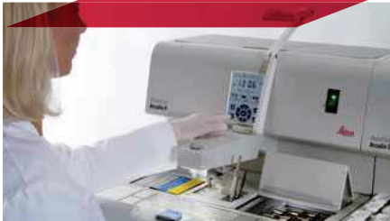
LARGE WORK AREA

The symmetrical and unobstructed workspace reduces distractions and allows you to keep your cassettes, molds and other accessories warm and at hand for a smoother workflow .