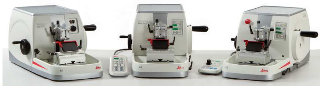
HistoCore BIO CUT

Introducing our complete line of Clinical Microtomes, designed with the user in mind. We are committed to providing consistent quality and enhanced efficiency, while maintaining a safe and healthy workplace.