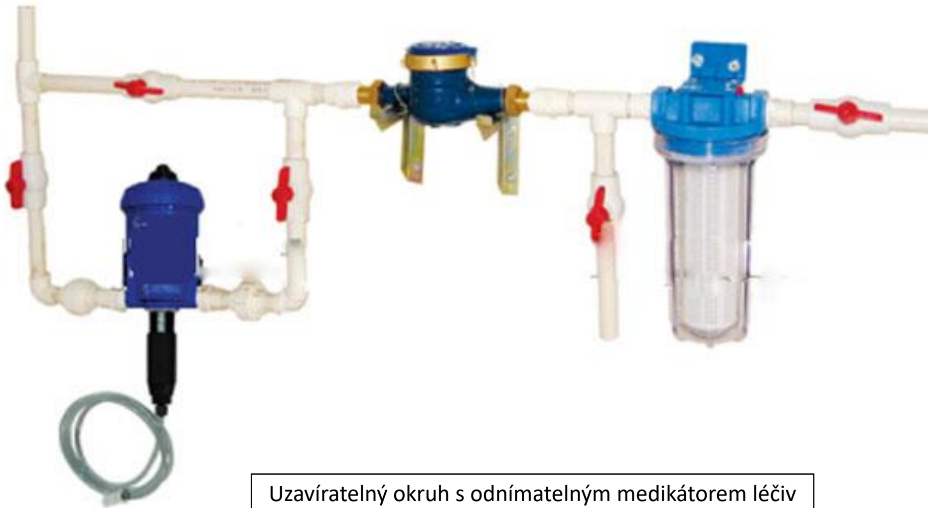
Uzavíratelný okruh s odnímatelným medikátorem léčiv